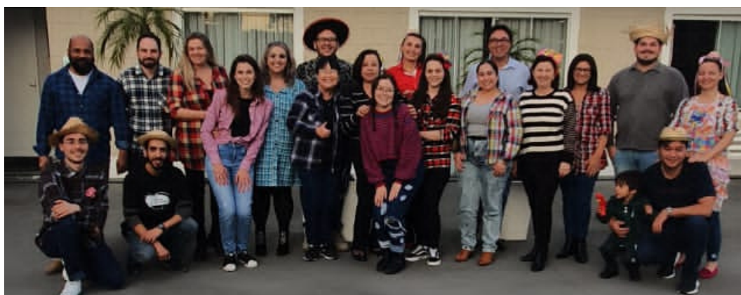
Festa Junina 2022