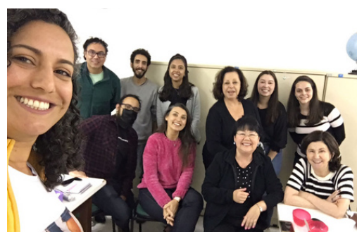
Registro de uma reunião