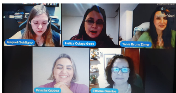
Live de divulgação Boletim n.2